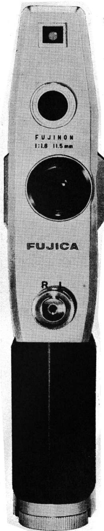
Fujica single-8 P1 har en karakteristisk smal form set forfra.

Til single-8 vil vi i første omgang se to Fuji optagermodeller: Fujica single-8 P1 og Fujica single-8 Z1. Den første er en fuldautomatisk optager med CdS-måler og fixed-focus optik. Udsalgsprisen kommer til at ligge på kr. 462,-. Den anden optager Fujica single-8 Z1 har zoomoptik f:1,6/9,5-29 mm; prisen er her kr. 865,-.