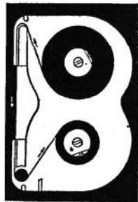
Skematisk tegning af filmens løb i single-8 kassetten.

I første omgang leveres en Fujichrome R25 (25 ASA), i single-8, en dagslys-omvendefilm som efter sigende skulle kunne måle sig med den berømte Kodachrome II i farver og skarphed. Filmen vil blive fremkaldt i Düsseldorf, hvor man har oprettet et fuldt moderne fremkaldningslaboratorie til formålet. Man kommer ned på en leveringstid af 8 til 10 dage